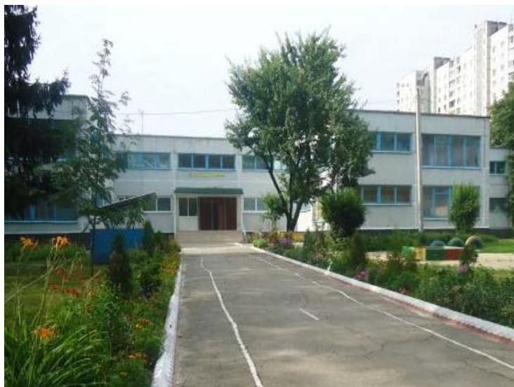
Вхід у дошкільний навчальний заклад № 458