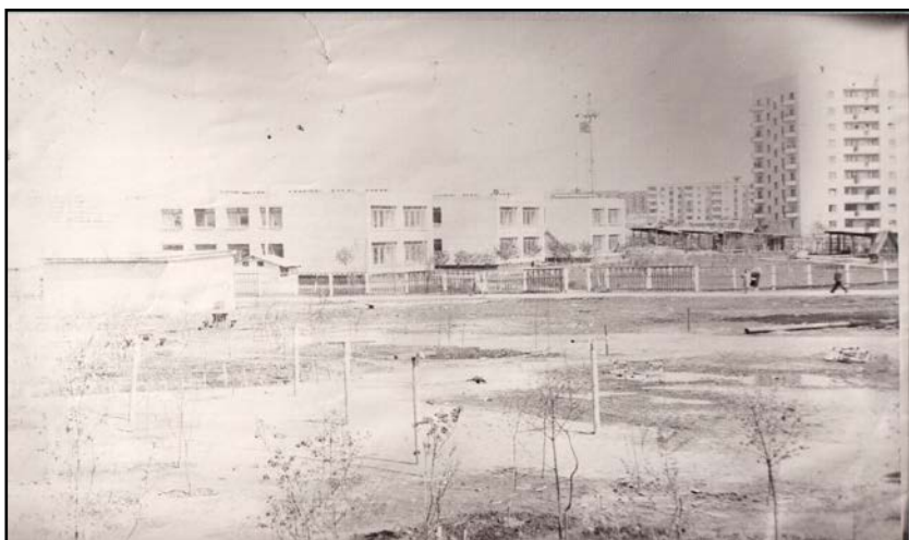
Будівля дошкільного навчального закладу № 458, 1969 р.

Комунальний заклад «Дошкільний навчальний заклад (ясла-садок) № 458 комбінованого типу Харківської міської ради» було споруджено в одному з заводських районів Харкова – Комінтернівському.